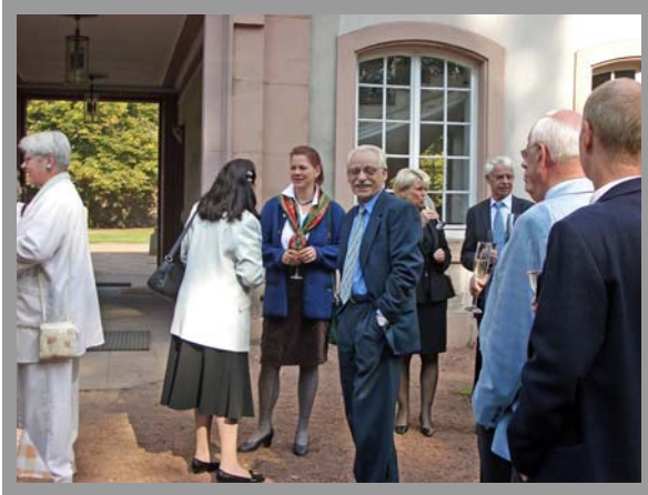
Smalltalk beim Eintreffen