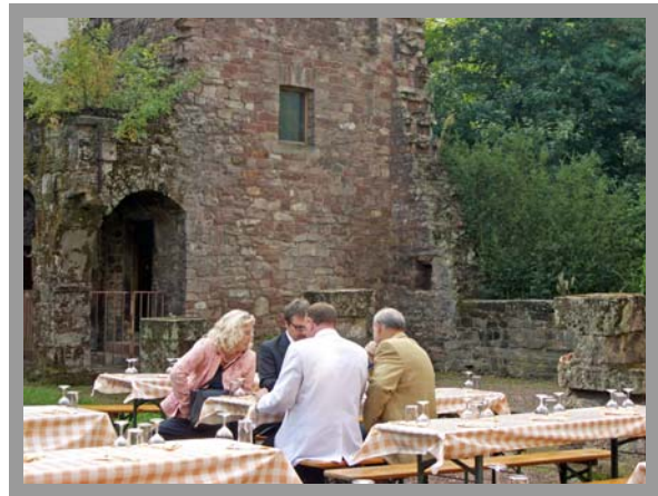
Lagebesprechung in historischer Umgebung