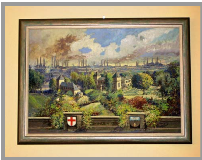
Gemälde, Dillingen im Jahre 1909

Der Veranstaltungsort tangiert in Person von Fürst Ludwig die Wurzeln der Saarbrücker Loge: „Bruderkette Zur Stärke und Schönheit“.