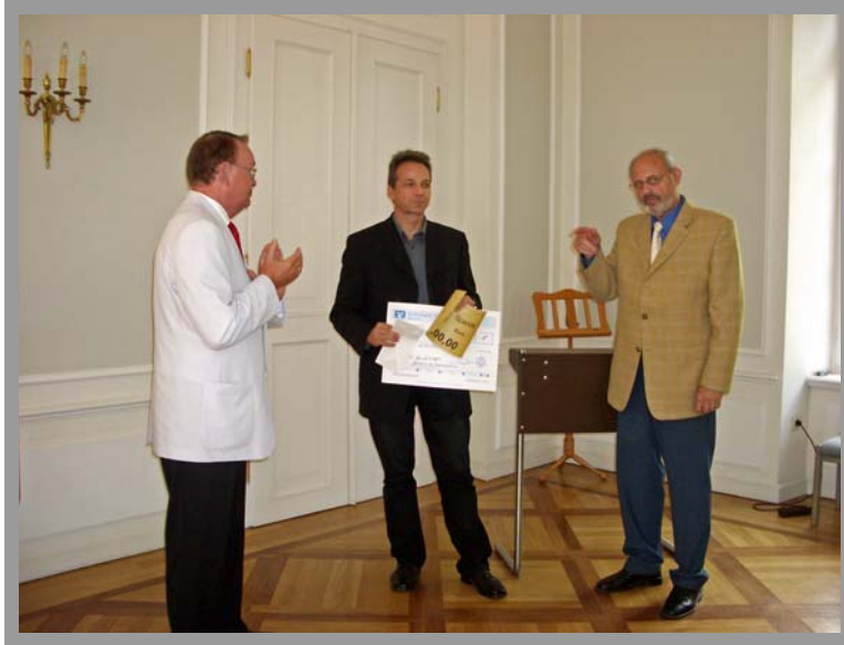
Zwei Schecks! Ein guter Tag für das Demenz-Zentrum Saarlouis