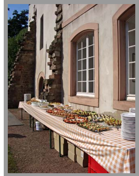
Es ist angerichtet!