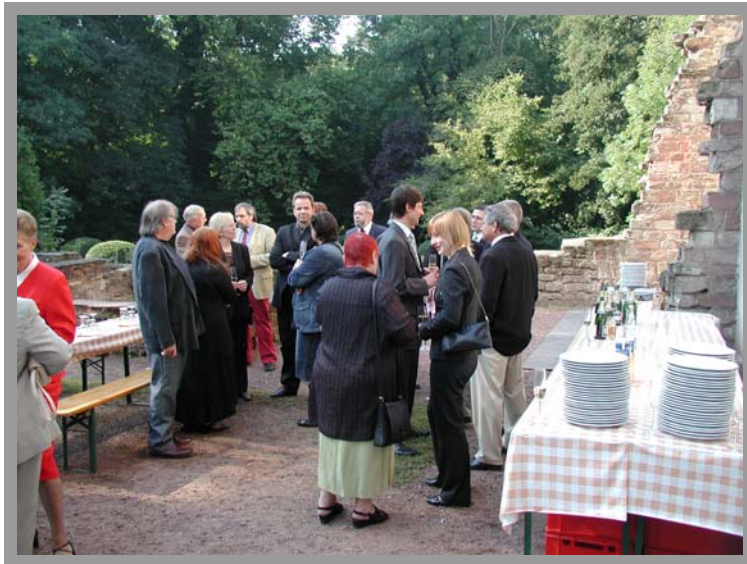
Große Ereignisse werfen ihren Schatten voraus